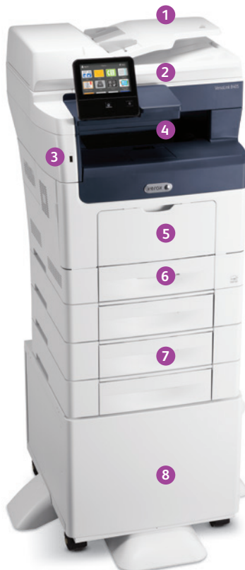
Xerox® VersaLink® B405 multifunctionele printer Print. Kopieer. Scan. Fax. E-mail.