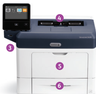
Xerox® VersaLink® B400 printer Print.

2 USB-poorten kunnen worden uitgeschakeld; 3 alleen voor VersaLink B405.